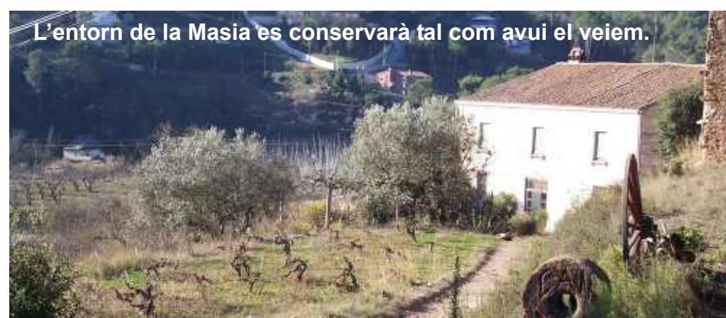
L'entorn de la Masia es conservarà tal com avui el veiem.

La xarxa de camins es fa amb l'objectiu de que el màxim nombre d'estudiants puguin anar a l'escola a peu.